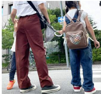
[従来の商品を使用している様子]