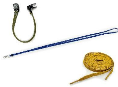
「3つのひも製品がセット」

現在、コロナによる在宅時間が増えた事により、散歩・ウォーキングを実施している人口が増加しています。笹川スポーツ財団「スポーツライフに関する調査」によると、2020年の年1回以上散歩・ウォーキング実施率は47.5%で2018年調査から2.6ポイント増。（※ https://www.ssf.or.jp/thinktank/sports_life/data/walking.html ）一方で、反射材への認知があり安全性向上への効果があると感じている人は9割だが、実際に使用している人は2割程度という調査結果もあります。（※全日本交通安全協会「反射材の普及活用に関する調査研究」 https://www.jtsa.or.jp/topics/pdf/houkoku.pdf ）